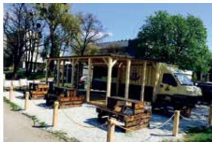
Lokalizacja pod Halą Stulecia

Food truck Bratwursty stoi bezpośrednio przy Hali Stulecia, więc to kolejne miejsce gdzie możecie zamówić lunch, potem go skosztować na pobliskiej ławeczce podziwiając uroki okolicy.