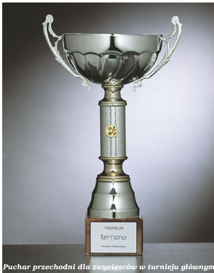
Puchar przechodni dla zwycięzców w turnieju głównym

Memoriał pod patronatem Prezydenta Miasta Poznania