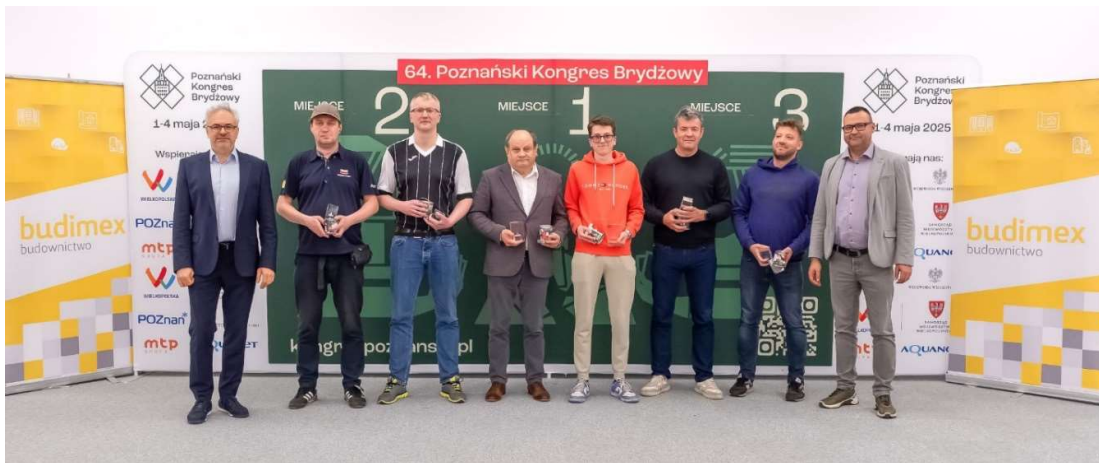
Poznań 4.05.2025 r.