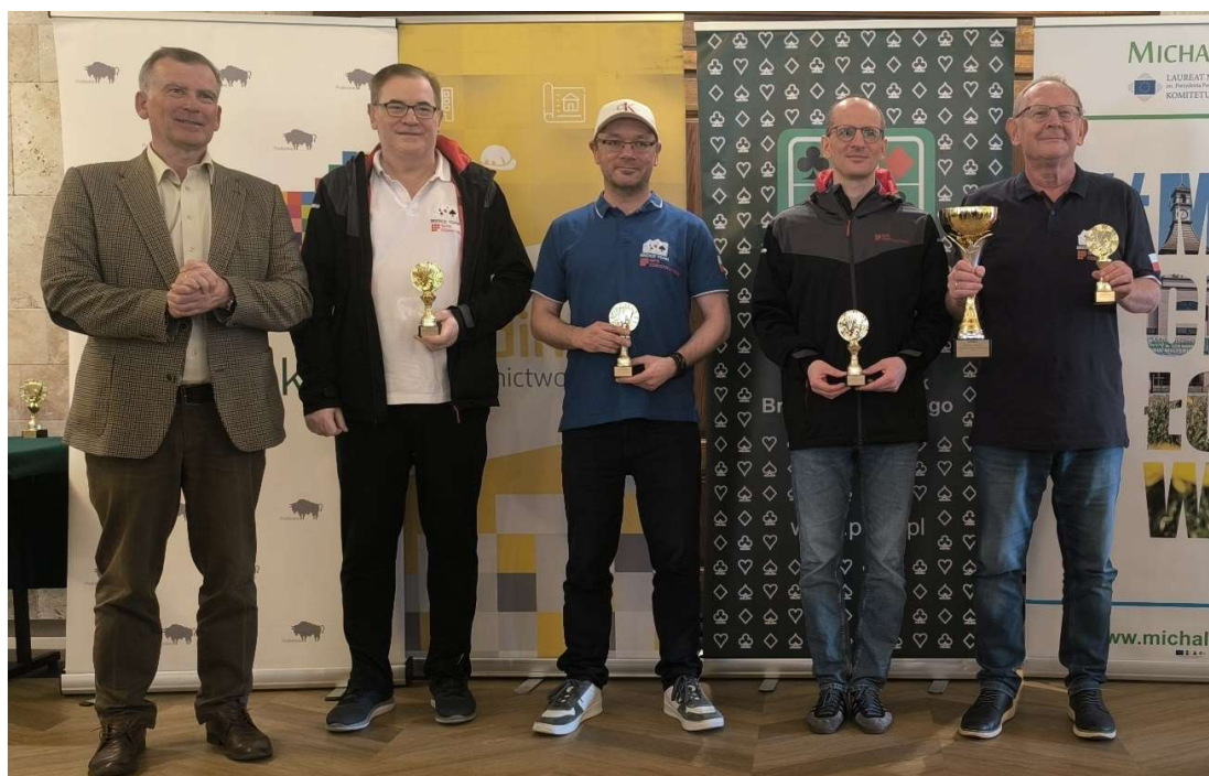
Lipowy Most 4-6.04.2025