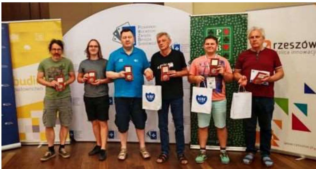
Rzeszów 16.08.2025 r.