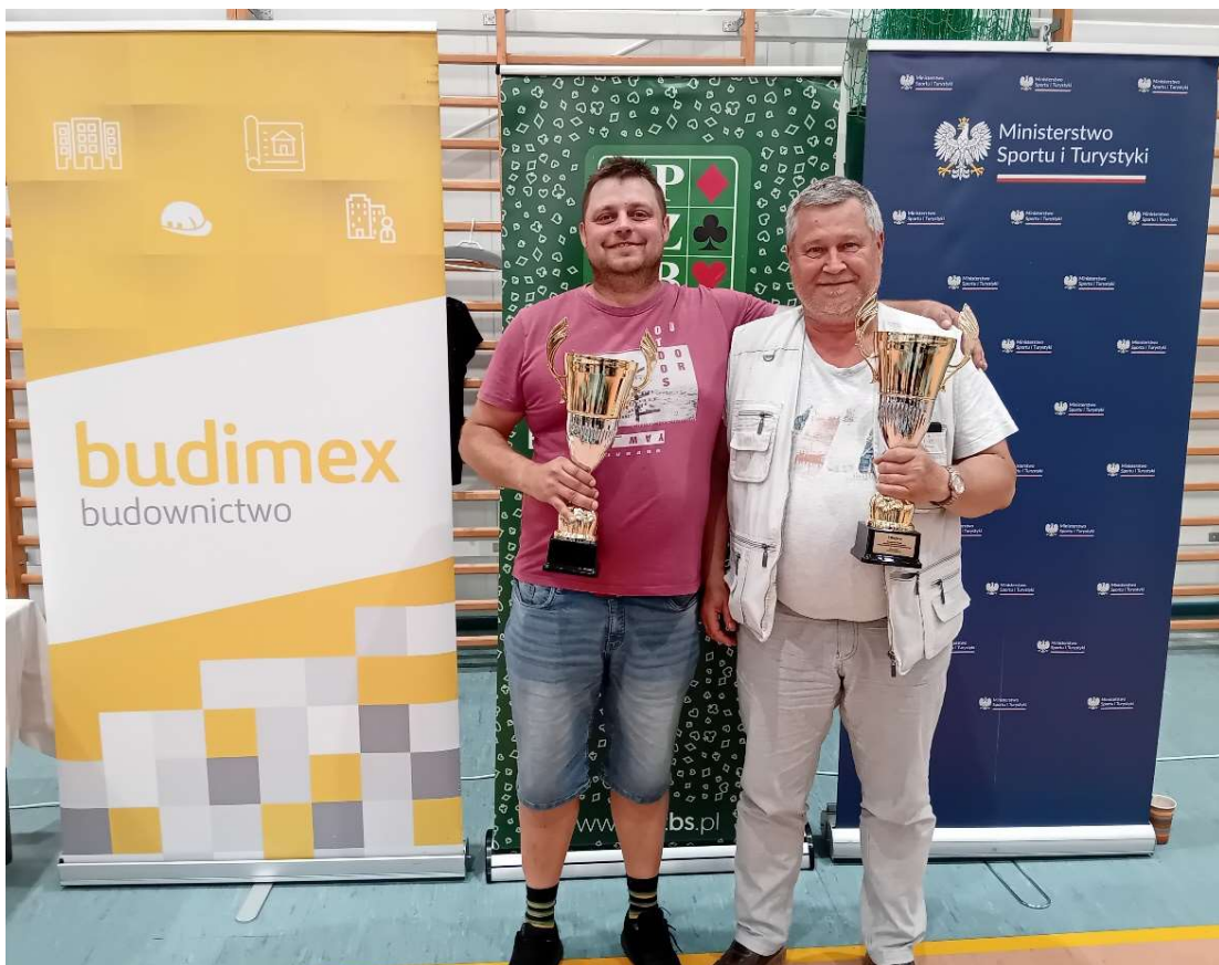
Łódź Lidzbark Warmiński 6.07.2025