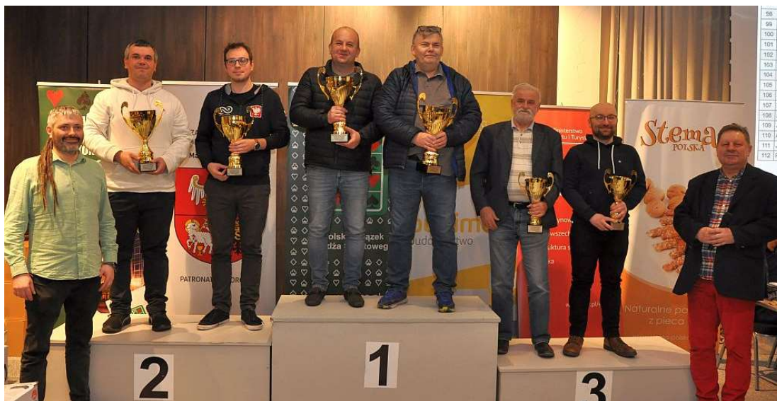
Warlity Wielkie 02.03.2025 r.