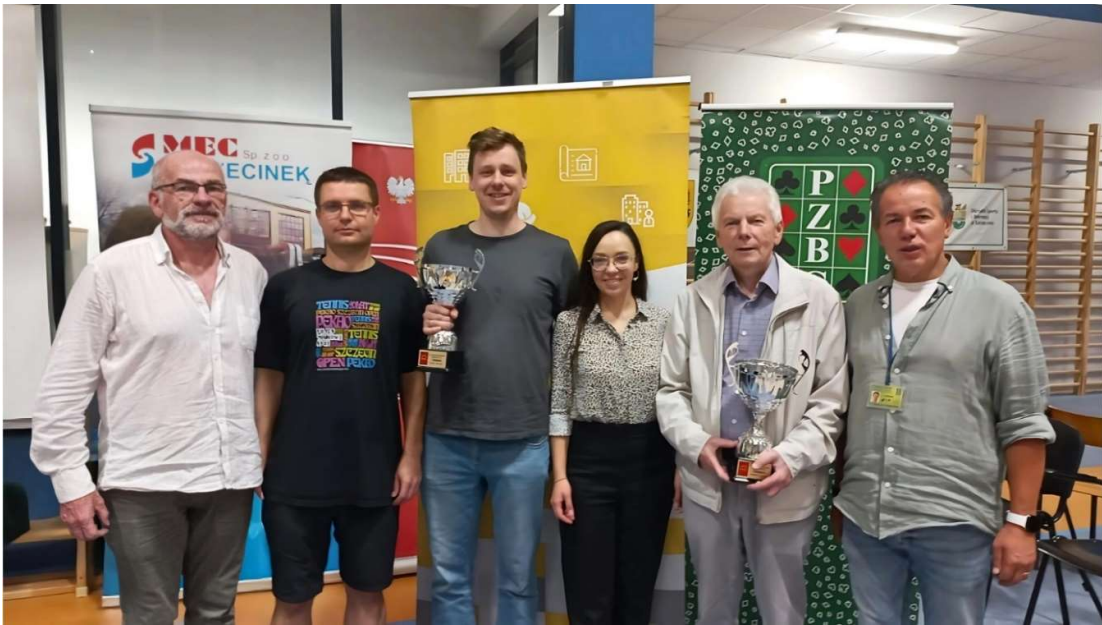
Szczecinek 13.07.2025 r.